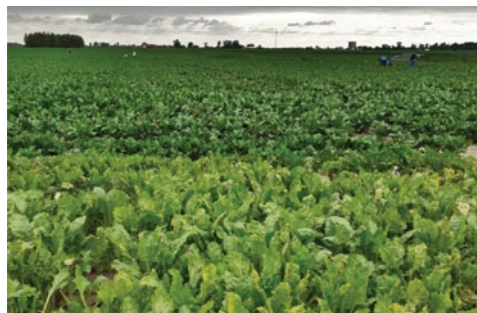
Nitron-S – 40 l/ha (w głębi, kontrola na pierwszym planie), Gozdowo, 2020 r.

Multi-N i Nitron-S są rezultatem kilkuletniej współpracy pomiędzy Uniwersytetem Techniczno Przyrodniczym w Bydgoszczy, firmą Biostyma i Micromix Wielka Brytania.