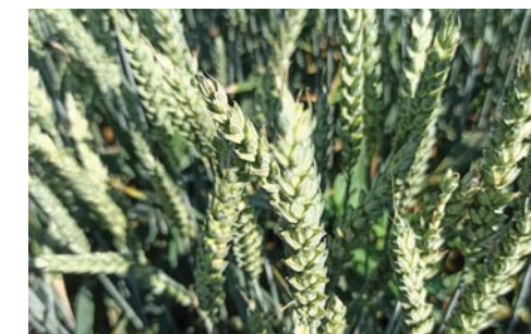
Nitron-S – 80 l/ha, Sokolniki koło Wrześni, 2020 r.