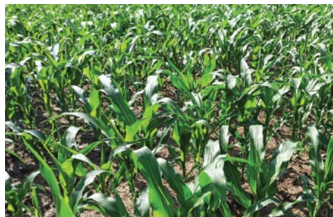
Nitron-S – 50 l/ha, Bieganowo koło Wrześni, 2020 r.