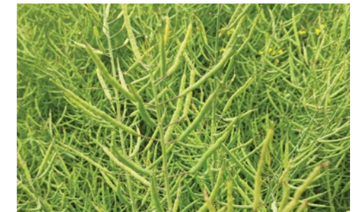
Rzepak po zastosowaniu Multi-N w dawce 45 l/ha w okresie opadania płatków.